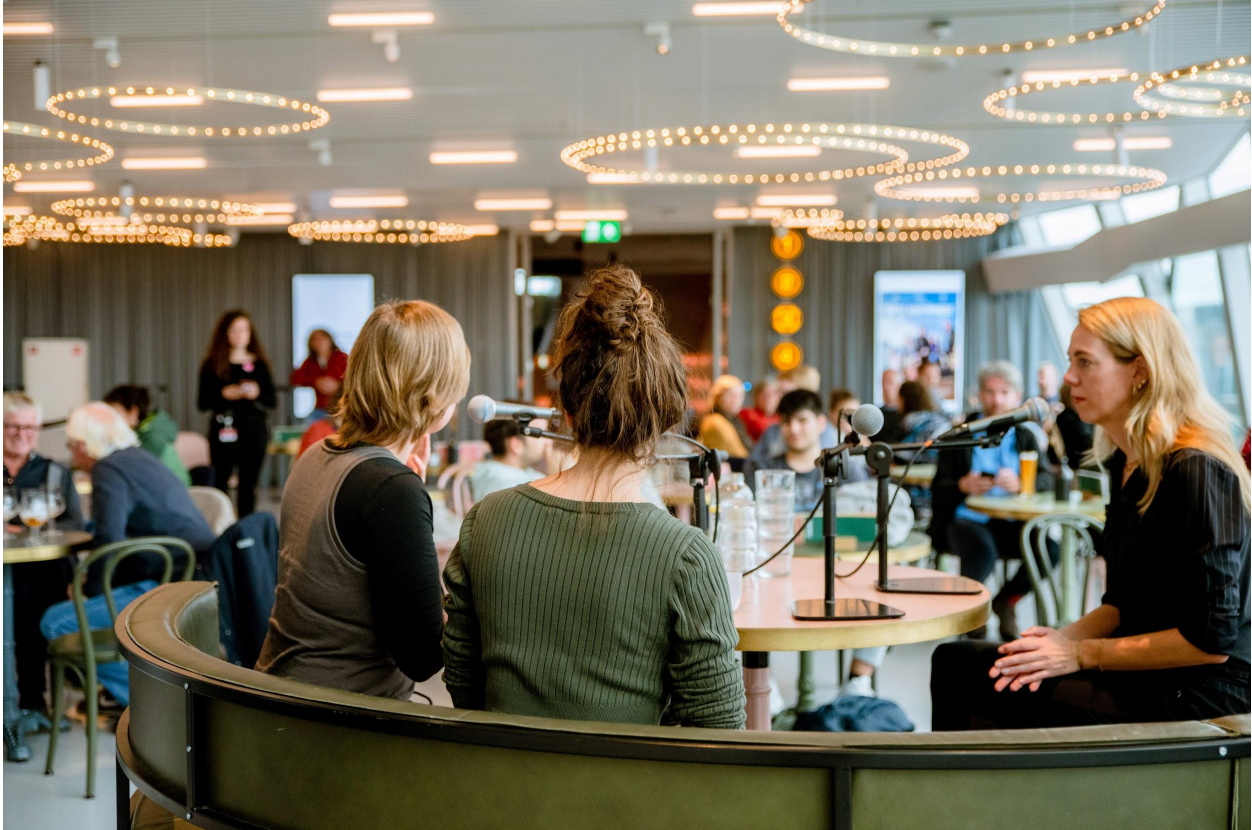
Bezoekers luisteren naar talkshow met lokale podcasters tijdens de editie in FORUM Groningen

In de evaluatie met zowel het bestuur als de uitvoerende producenten kwamen de krappe planning, dito budget en het wegvallen van de algemeen coördinator steeds terug als knelpunten. Bovendien heeft het festival in de afgelopen coronajaren steeds pech gehad met maatregelen, waardoor het lastiger is gebleken om een vast publiek op te bouwen. Voor de toekomst onderzoekt het bestuur dan ook mogelijkheden om een duurzaam team in te richten, zodat niet alle druk en kennis bij met name één persoon ligt. Dit vraagt om een structurele financiële verantwoordelijkheid. De fondsenwerf mogelijkheden hiervoor zijn beperkt in de culturele sector, het vergt tijd en ruimte om dit kip-of-ei probleem op te lossen. De stichting bevindt zich op een cruciaal en complex doorgroeimoment dat onze tijd en aandacht vraagt en waar we ons momenteel op bezinnen.