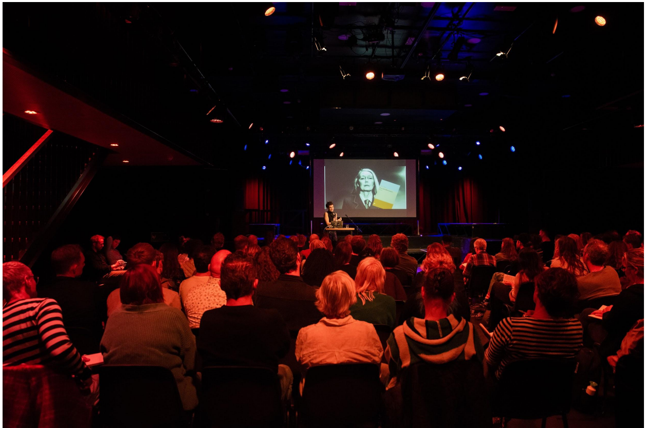
De masterclass van Avery Trufelman tijdens de conferentie in Amsterdam in de Tolhuistuin