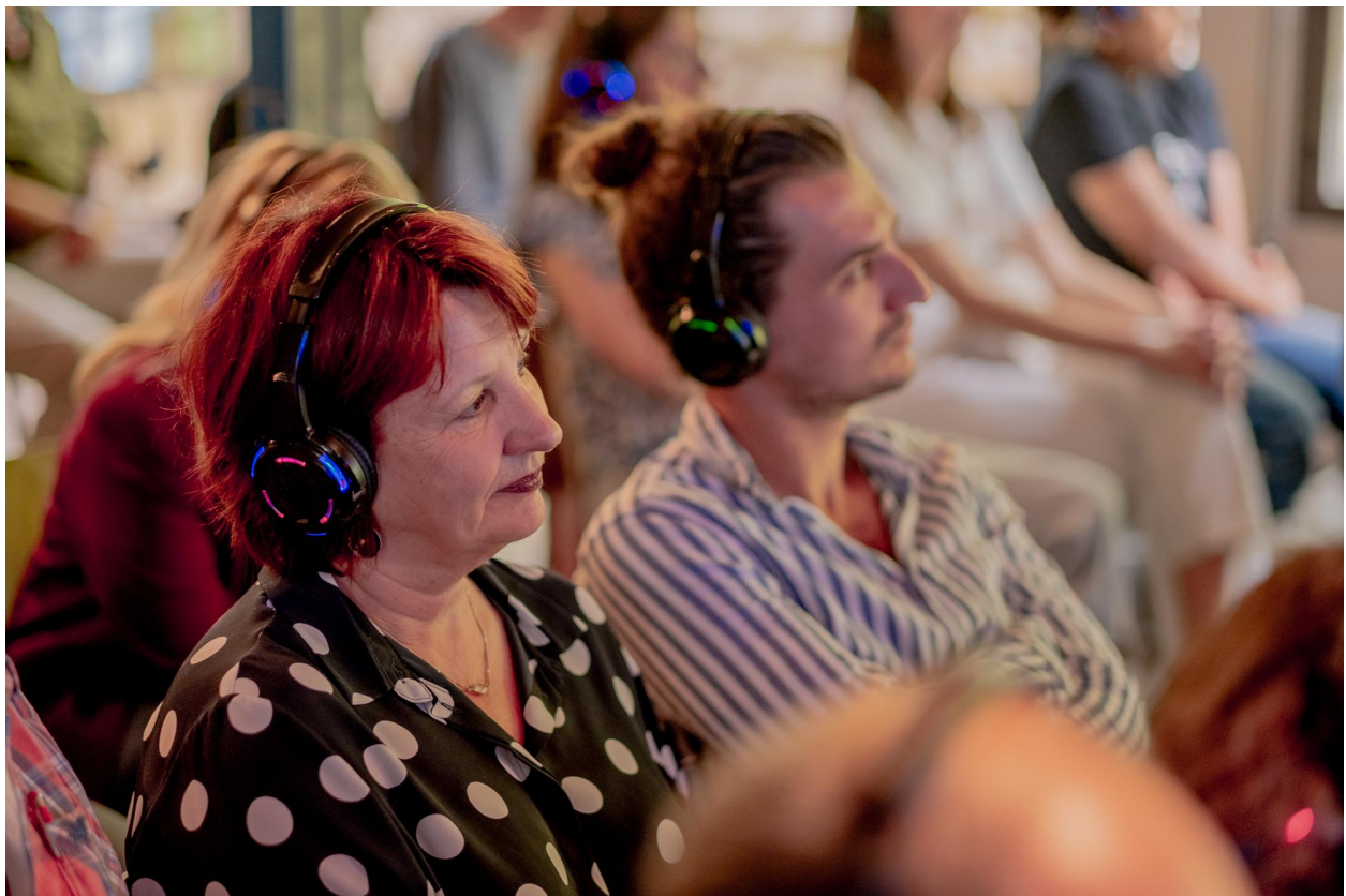
Aandachtig luisterend publiek tijdens de presentatiemiddag van groep 3 en 4, juni 2022 te Amsterdam

Uiteindelijk zijn 48 deelnemers in 2 fases (in totaal 4 groepen van 12) gestart waarvan er 26 een audiotrailer hebben laten horen op een van de twee presentatiemomenten eind januari en juni 2022. Op deze bijeenkomsten waren eindredacteuren, podcastcoördinatoren, geïnteresseerden en medewerkers van podcastproductiehuizen aanwezig. Zij luisterden naar de audiotrailers, de interviews met de makers en gingen vervolgens met hen in gesprek.