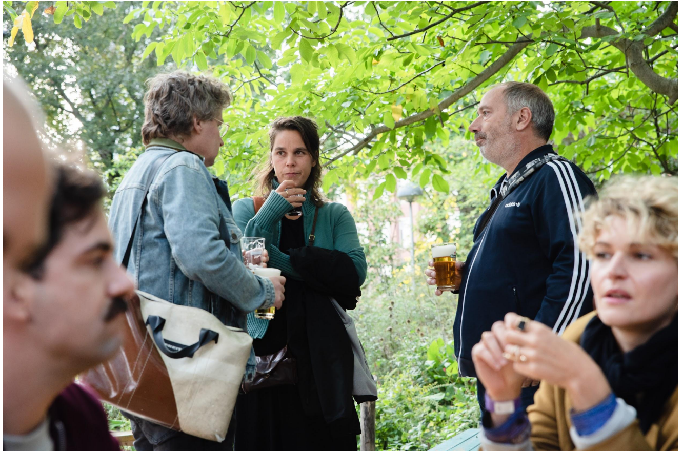
Podcasters ontmoeten elkaar met een drankje bij de borrel

het ontwikkelen van verschillende sponsorpakketten en -mogelijkheden.